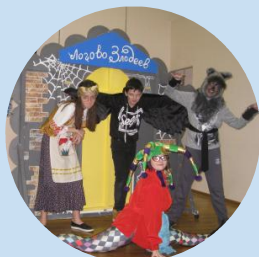
Новогоднее чудо от "Бригантины"