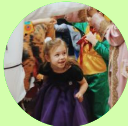
Волшебники ШУС в действии