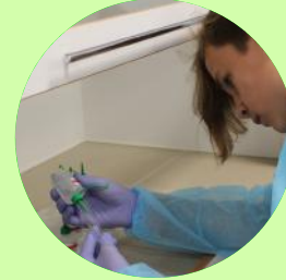
«Интеллект» – цель и мечта